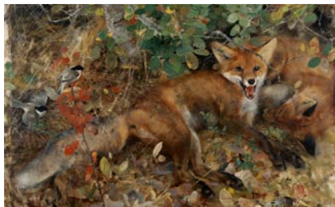
Rävar_Göteborgs konstmuseum

Ange aktivitetens nummer och deltagarnas namn när du betalar - annars vet vi inte vem pengarna kommer från.