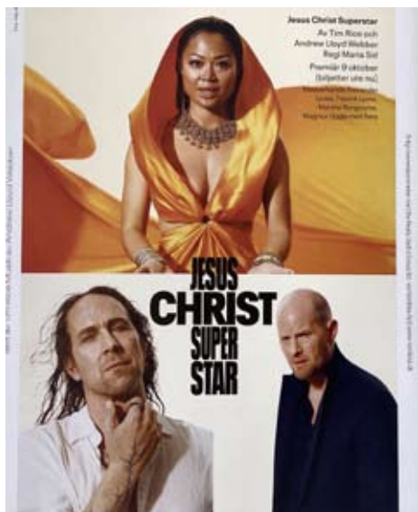
20261205 Jesus Christ Superstar